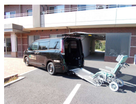
トヨタ 「エスクアア」